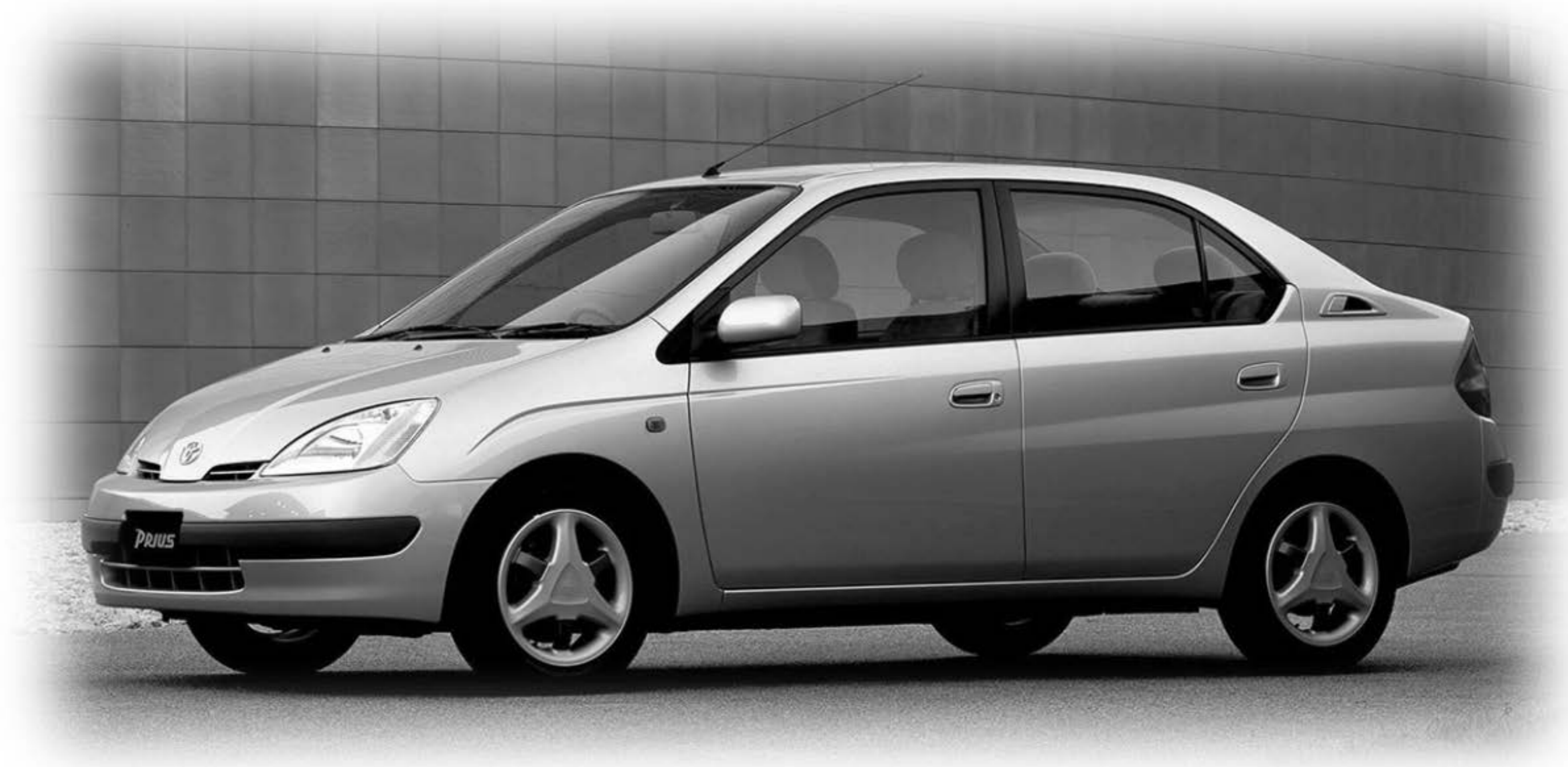
The first PRIUS