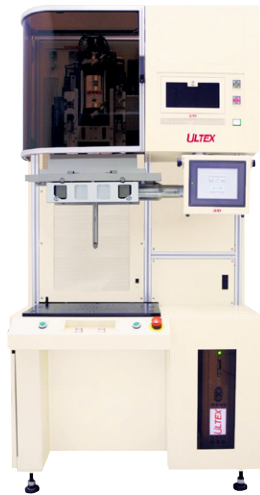
15/20MZi Lab system