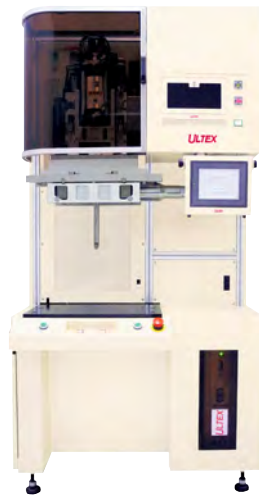
15/20MZi Lab system