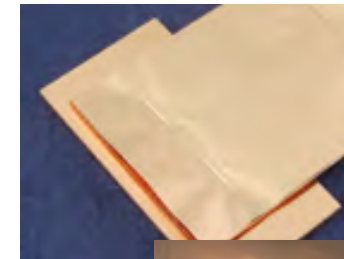
【銅積層箔と銅プレートの2カ所個別接合】