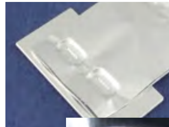
【アルミ積層箔とアルミプレートの2カ所個別接合】