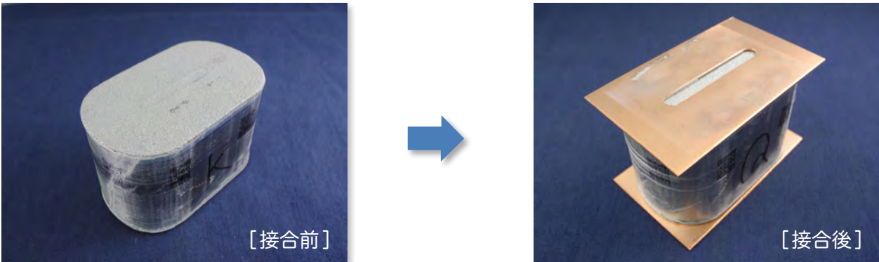
[超大型フィルムコンデンサと銅電極板の両面接合]